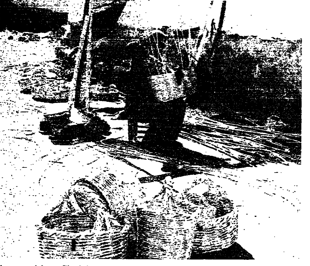
صناعة السلاسل ، حرفة ينادية ، تطوي على الكثير من الذوق والجمال ، عندما يلين القصب ويخضع ويذوق حول نفسه ويشدك آخرها يكون حزيناً للخسار او تقاسم للسك . الا ان هذه الحرفة ، ثن ، وتنهضت اذ لا بد من ان يجرح القصب تلك اليدي التي تحوله الى سلاسل ، ويصير القصب شفرة والماء خطاً ، والصايع ابراً التي تجر هذا اللون الشبيه بالذهب ، ( القلطة لمجد الرزاق ) .